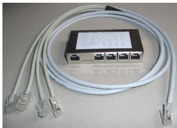
SePhone 4-er Telefonieverteiler inkl. Hydrakabel 2m (1xRJ45 auf 4x RJ45) Art.nr. 599031

SePhone 4-er Telefonieverteiler inkl. Hydrakabel 2m (1xRJ45 auf 4xRJ45) Art.nr. 599031